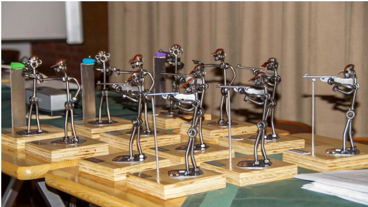
Die Mannschaftsauszeichnungen hoch konzentriert beim Zielvorgang 2017