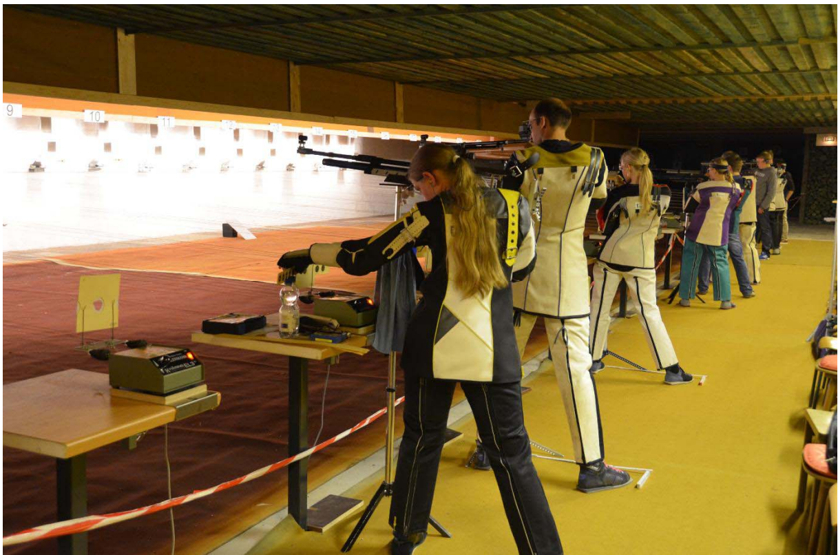
konditionsstarke Luftgewehrschützen im Jahr 2012