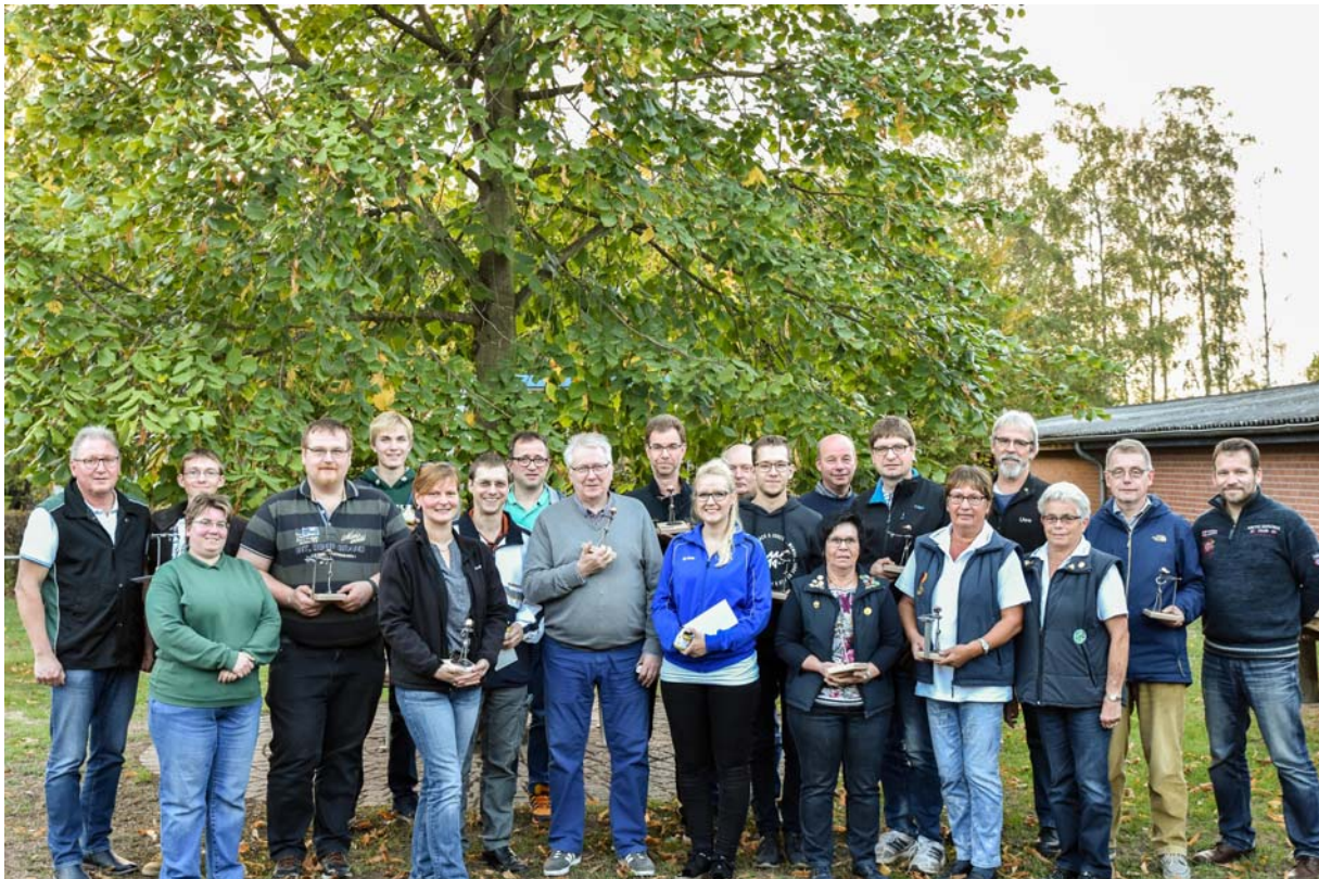
Strahlende Gesichter im Anschluss an die Siegerehrung 2018