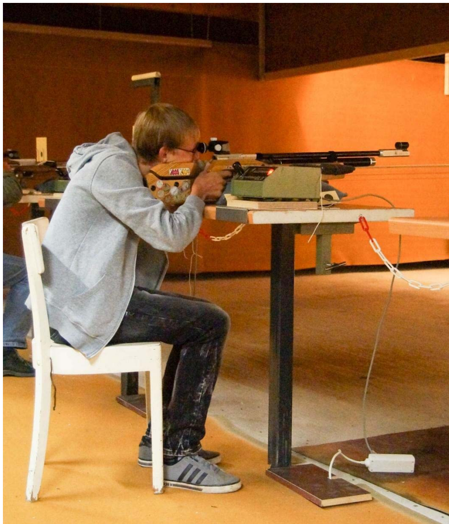
Den Standrekord erfolgreich im Visier – 1069,0 Ring !! 2015