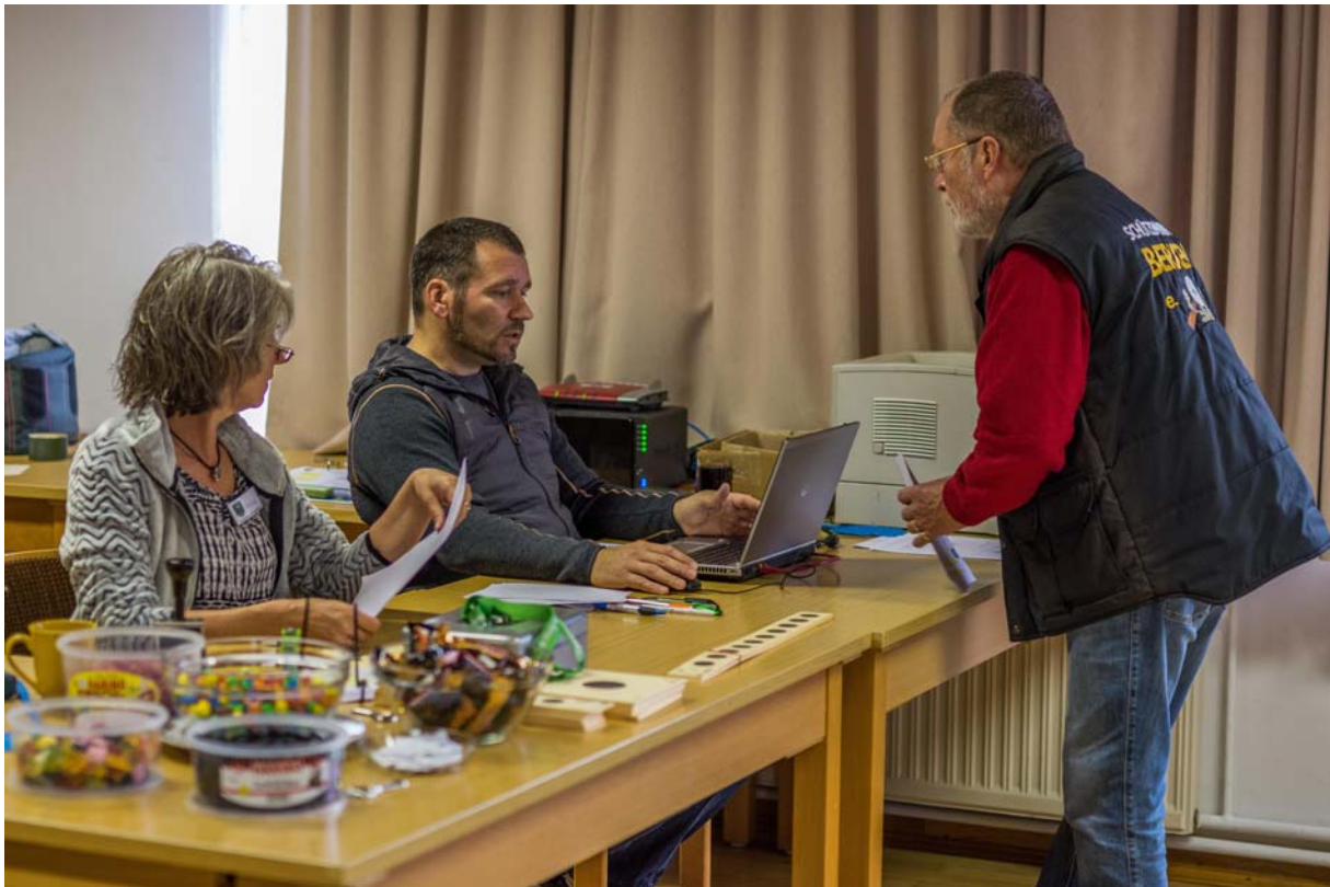
Ein eingespieltes Team auf beiden Seiten des Tisches an der Anmeldung 2019