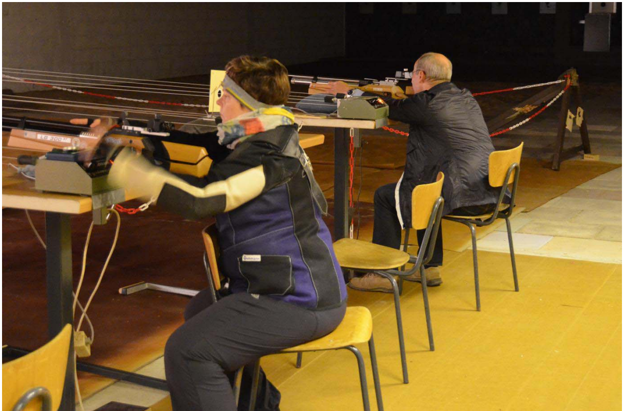
„Sandsack“-Schützen konzentriert bei der Sache 2013