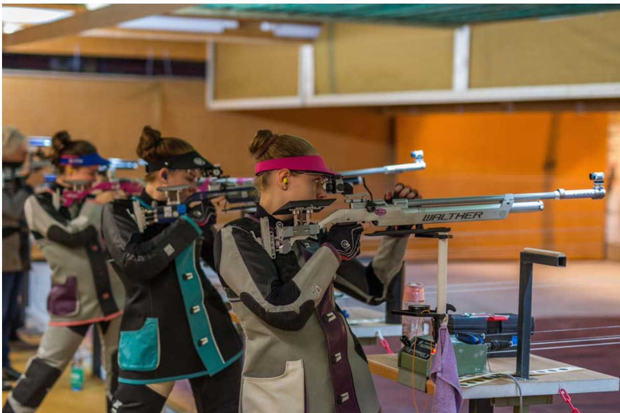
Junge Schützinnen setzen ein Ausrufezeichen 2019