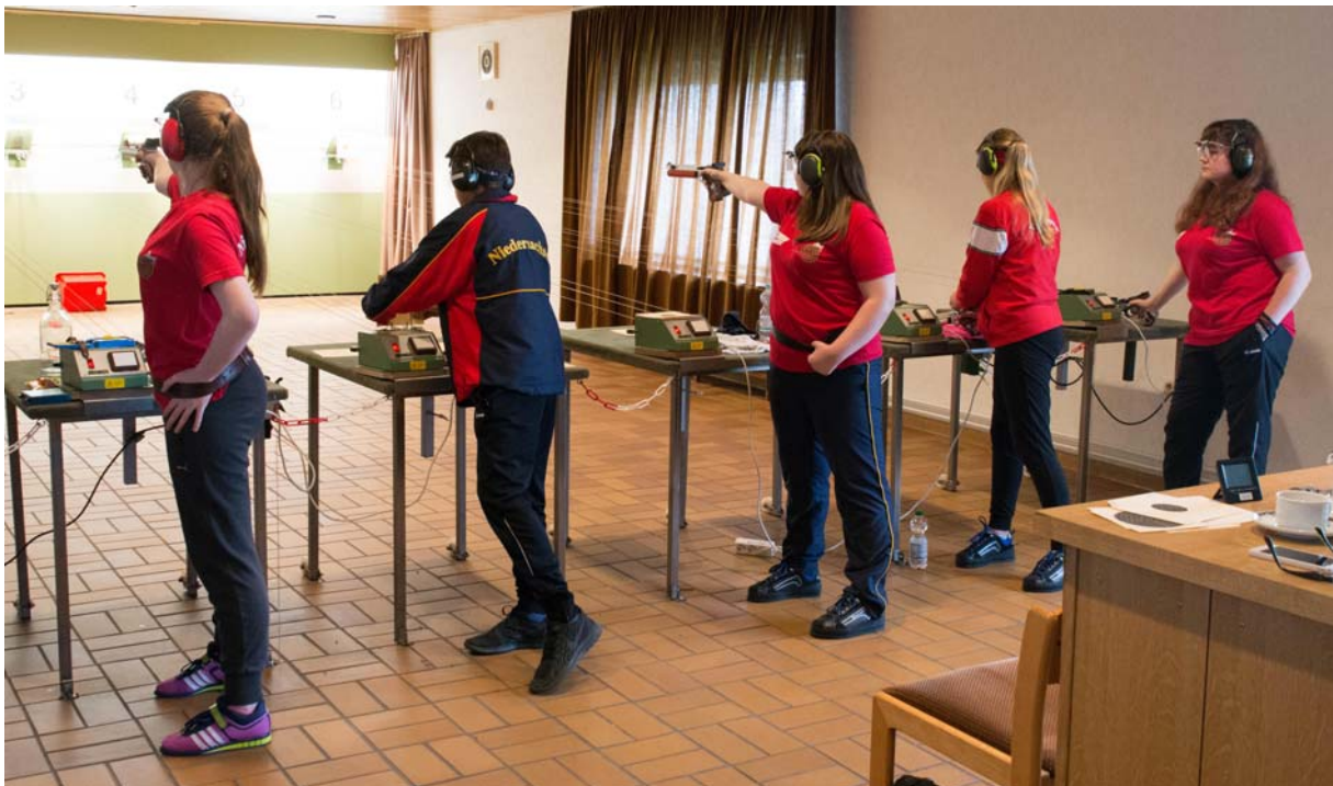
...und natürlich auch vor den Scheiben in der Praxis 2016