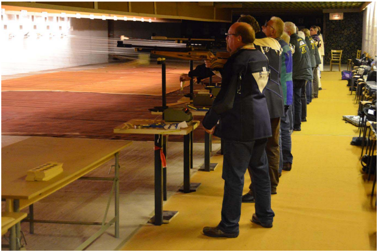
Auflageschützen 2011 während ihres Wettkampfes