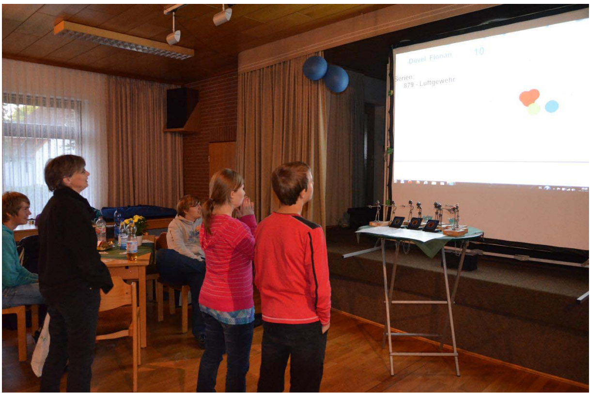
Mitfiebern bei der Auswertung 2012