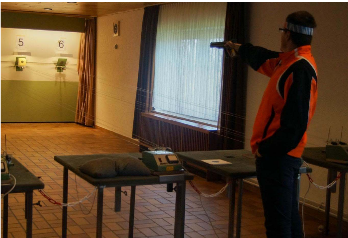
Ein zielsicherer LP-Schütze beim Wettkampf 2015