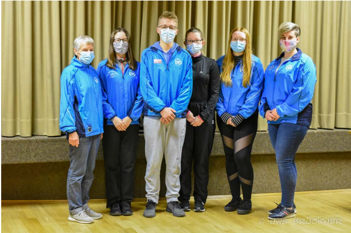
„Strahlende“ Konditionsstarke und neue Rekordhalter LG-Einzel und Mannschaft 2020