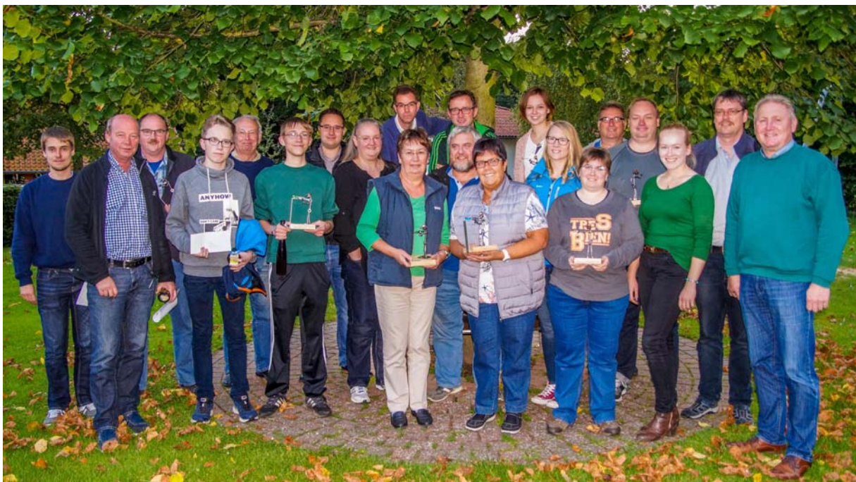
Konditionsstarke Sieger und Platzierte 2017